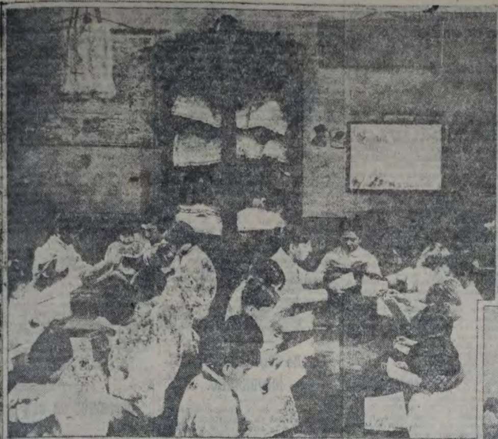
EN LA SALA DE LECTURA

Una obra meritoria que merece extenderse