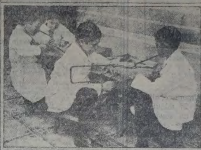
RECOLECTANDO MADERAS PARA CONFECCIONAR JUGUETES