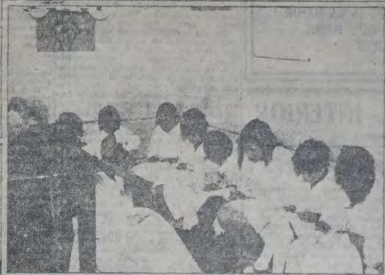
NIÑAS ENTREGADAS a la confección de libros propios de su edad y sexo