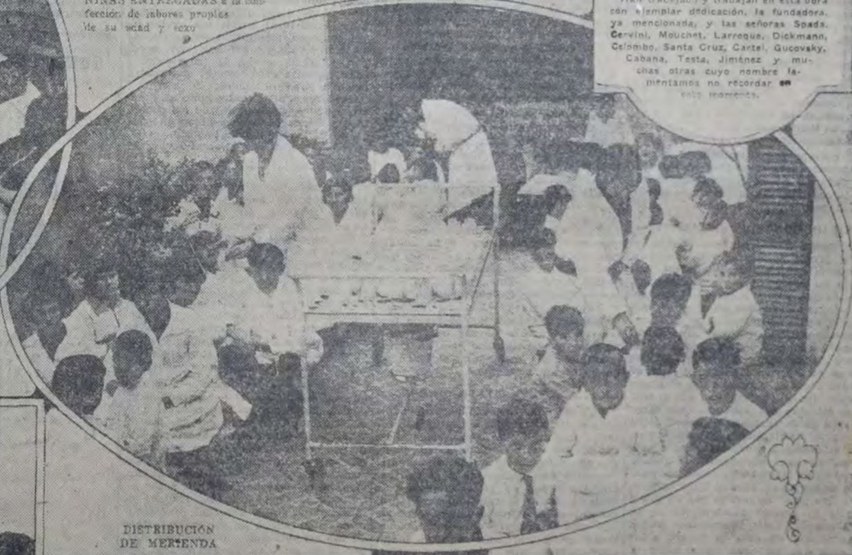
DISTRIBUCION DE MERIENDA