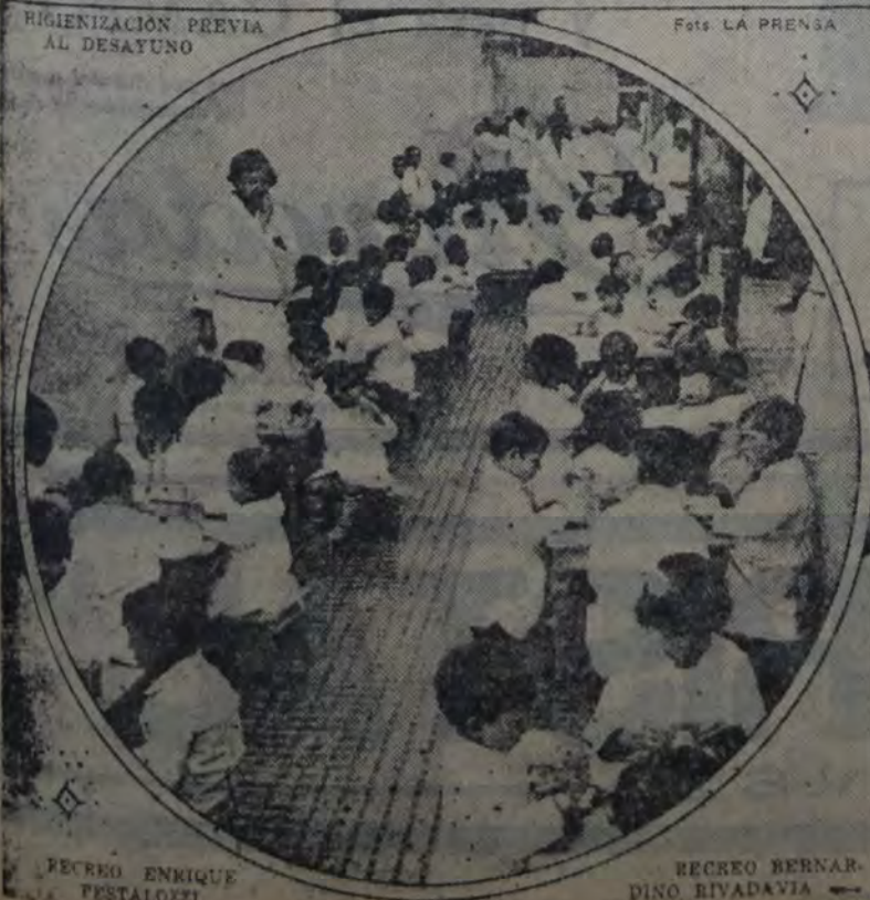
RECREO ENRIQUECEDOR BERNARDINO RIVADAVIA